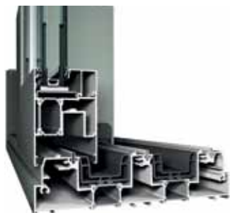
CP 155 3 guías