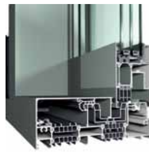
CP 155-LS/HI con etiqueta Minergie