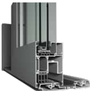
CP 155-LS/HI umbral de altura reducida